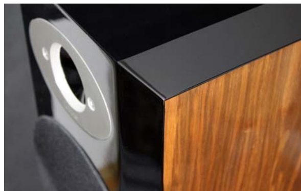
Verarbeitung und Oberflächenfinish der Ichos N°Four MkII SE wirken hochwertig

rer Lautsprecher wie den Kaiser Kawero Classic oder gar den Über-Hörnern Vox Olympian finden lassen. Darüber hinaus ersetzt Ichos die üblicherweise zur Dämmung verwandte Mineralwolle durch reine Schafwolle.