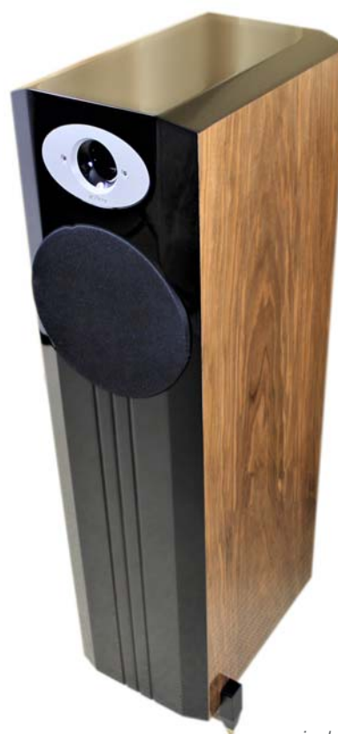
Die Ichos N°Four MkII in der SE-Version

Tonal blieb nun alles im Lot – und pfeilschnell waren ja bereits die No°Two unterwegs. Ähnlich schnell war der Entschluss gefasst, ein zweites Mal Gastgeber der rückwärtig geladenen Hörner aus Wien zu werden und nunmehr die Ichos No°Four in meinen Hörraum einzuladen.