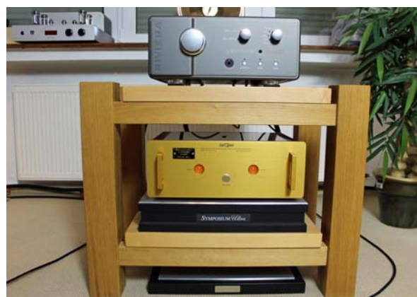
Stereoendstufe Dartzeel NHB-108, darüber der Hybridvollverstärker Riviera Levante

stehen Lautsprecher in meinem Zimmer üblicherweise leicht auf den Hörplatz eingewinkelt, wodurch sich eine bessere Abbildungspräzision und Raumdarstellung ergibt. Dergestalt ausgerichtet, sondern die beiden Kompressionstreiber für meinen Geschmack einen Hauch zu viel Hochtonenergie ab. Schnell wird klar: Die Ichos wollen idealerweise nicht auf Achse gehört werden, sondern nahezu parallel zueinanderstehen. Auch etwas Abstand zu Rück- und Seitenwänden schadet nicht. Zwischen 80 und 150 Zentimeter sind eine gute Idee. Ratsam ist es außerdem, eine möglichst waagerechte Höheneinstellung der Lautsprecher über die Kupferspikes vorzunehmen.