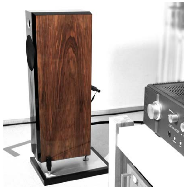
Ichos N°Four MkII SE im Hörraum

Bevor wir testen, was die N°Four MkII SE klanglich leisten, noch ein paar Worte zur Aufstellung. Bei einem Hörabstand von knapp unter drei Metern