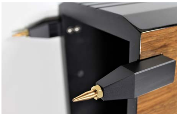
Die Ichos N°Four MkII SE kommen mit Bronzespikes von Liedtke-Metalldesign

Im Rahmen der „Tunig“-Maßnahmen wird der Ichos N°Four auch eine höherwertige interne Verkabelung zugestanden, deren versilberte Kupferlitzen für noch mehr Präzision und Schnelligkeit gut sein sollen. Ausschließlich bei der SE-Version kommen außerdem Kondensatoren aus verzinnter Kupferfolie und Silber-Graphit-Widerstände des legendären dänischen Herstellers Duelund zum Einsatz, dessen Bauteile sich auch in Frequenzweichen so ultrateu-